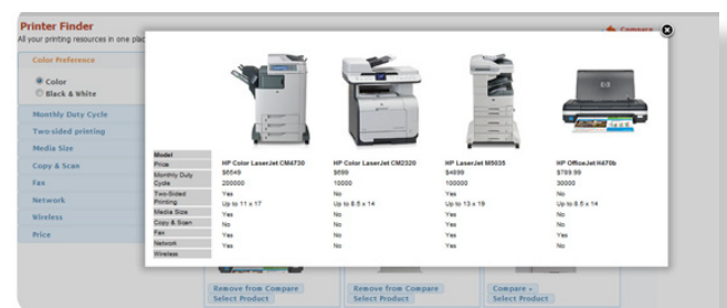
Auswahl von Produkten für einen direkten Vergleich

Die BigMachines eCommerce-Engine kann Posten aus einer Datenbank abrufen, so dass Sie und Ihre Kunden frühere Aufträge und Verträge einsehen können. Diese Informationen können für Neubestellungen, Produkterweiterungen und die Anpassung von Serviceverträgen verwendet werden. Die Daten können direkt aus Ihrer BigMachines Bestands- oder Vertragsdatenbank oder dem CRM/ERP-System Ihres Unternehmens übernommen werden. Sie entscheiden, welche empfohlenen oder erweiterten Produkte Ihr Kunde sieht. Sie können auch neue Servicevereinbarungen auf Basis der vorhandenen Kundenverträge anlegen.