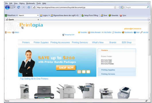
Verwenden Sie die BigMachines eCommerce-Engine zur Erstellung einer leistungsfähigen B2B-eCommerce-Seite, die das benutzerfreundliche Aussehen einer Verbraucherseite hat.

Die BigMachines Administrations-Plattform ist leicht zu bedienen. Außerdem bietet sie Ihnen eine personalisierbare eCommerce-Seite. Den individuellen Bedürfnissen Ihres Unternehmens kann so optimal entsprochen werden. Die intuitive Drag-and Drop-Oberfläche ermöglicht Ihnen eine leichte Anpassung und Verwaltung der Seitenlayouts sowie die Personalisierung Ihrer eCommerce-Seite entsprechend Ihrer Vorstellungen.